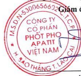
Đặng Tiến Đức