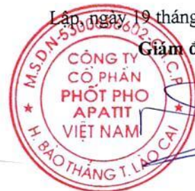
Đặng Tiến Đức